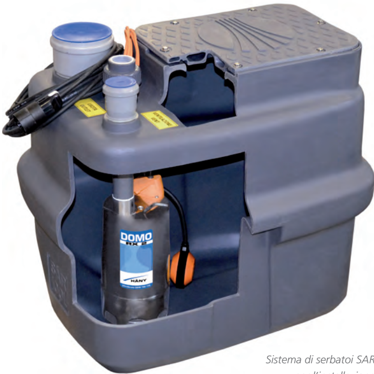
Sistema di serbatoi SAR per l'installazione a pavimento o interrata.

re, quindi, a un prezzo inferiore. L'intera gamma è inoltre disponibile a magazzino. I quattro modelli di pompe possono essere abbinati alla collaudata gamma di serbatoi SAR, gli impianti di sollevamento compatti per acque luride installati chiavi in mano con capacità di 40, 100 e 250 litri, la combinazione ottimale per il drenaggio di scantinati, lavanderie e garage interrati.